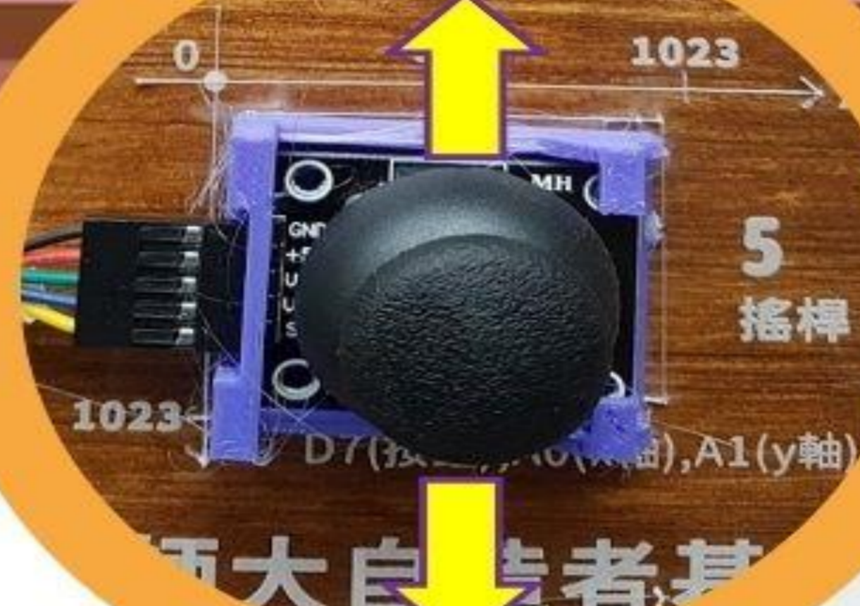
情境 3 上下搖桿 改變演奏速度