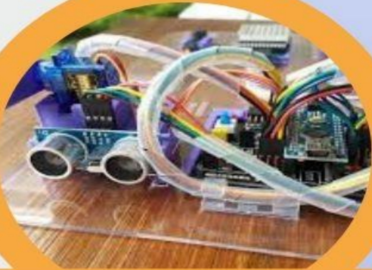
情境 1 靠近音樂盒 開始演奏轉動馬達