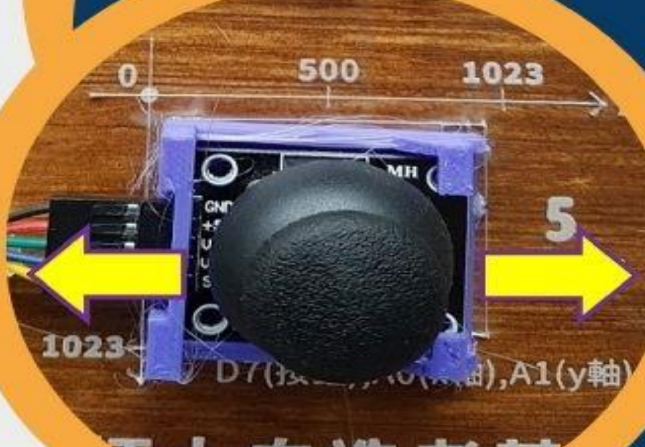
情境 4 左右搖桿 改變演奏曲目