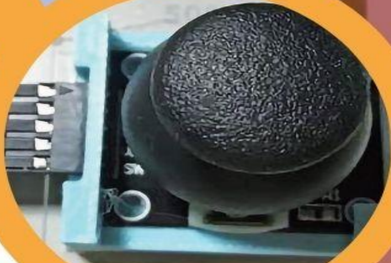
情境 2 按按鈕 改變演奏樂器